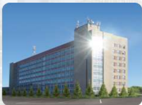
Институт механизации и технического сервиса