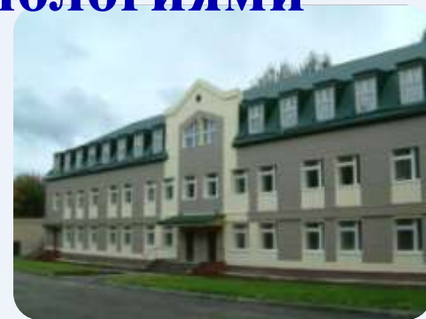
Факультет лесного хозяйства и экологии